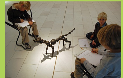
Kinolino in der Kunsthalle Kiel: Nach dem Film „Sergeant Pepper“ wurde in der Ausstellung „Cocker Spaniel and Other Tools for International Understanding“ gezeichnet.

Gerne beraten wir Sie auch individuell! Bitten Sie uns um ein maßgeschneidertes Angebot.